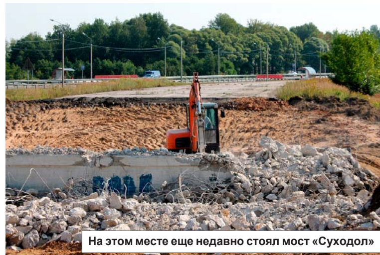
На этом месте еще недавно стоял мост «Суходол»