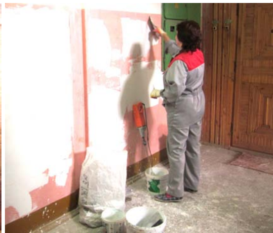
Ремонт подъезда в доме №1 по Школьному переулку