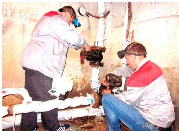
Специалисты МУП «Специальное хозяйство» готовят дом №3 по улице Чернышевского к отопительному сезону

Помимо управления многоквартирными домами в деятельности муниципального предприятия